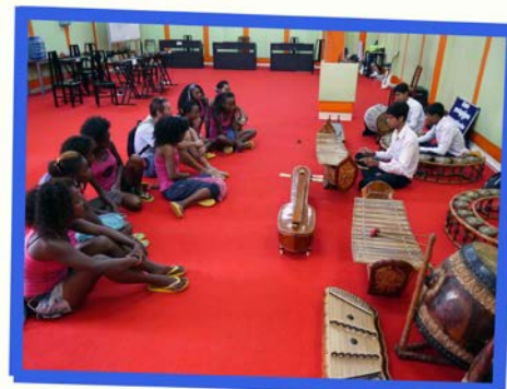
Discovering Khmer traditional instruments (Faculty of Music)