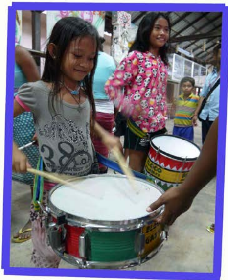
Percussion training at PSE