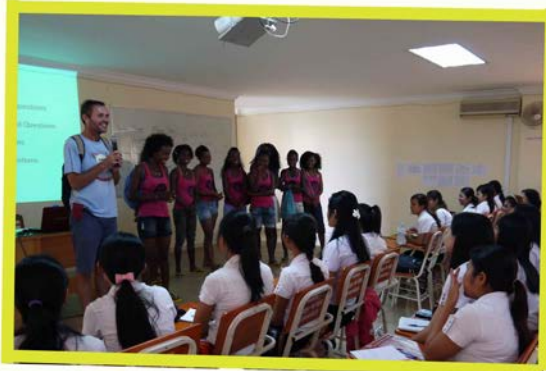
Visiting UBB student (Battambang)