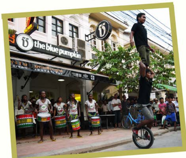
Street Show with Phare Ponleu Selpak at Blue Pumpkin (Siem Reap)