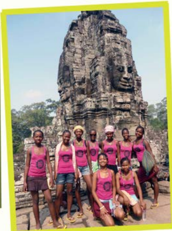
Angkor Wat temple (Siem Reap)