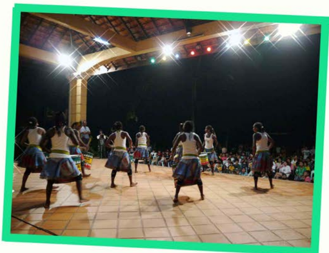
Concert at Arrupe (Apostolic Prefecture)