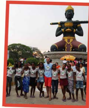
O'Dabang Buddha (Battambang)