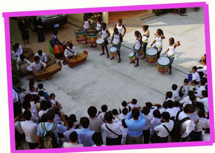
Mixing Cambodian music and batucada with Krousar Thmey and Cambodian Living Arts