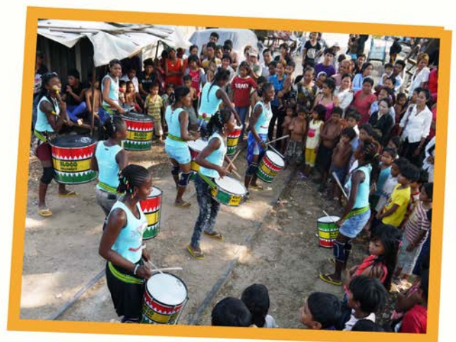
Performance in slum area of Toul Tork (Phnom Penh)