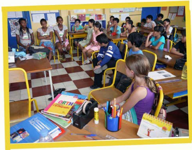
Workshop about Madagascar at French School