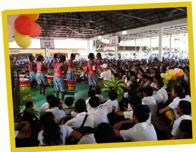
Concert at PSE