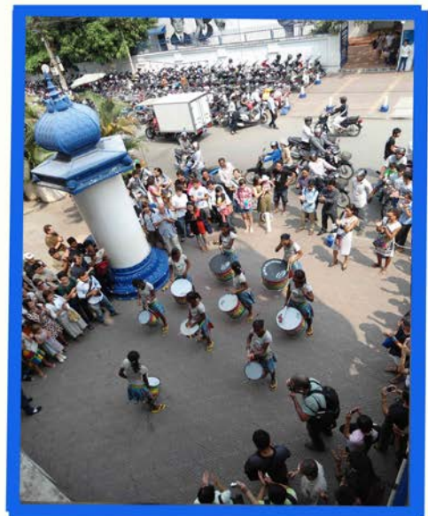
Concert at the French Institute of Cambodia (IFC)