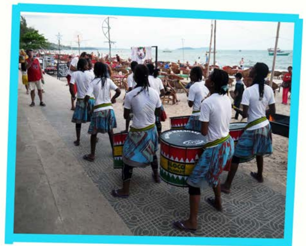
Parade at Otcheureal beach (Sihanoukville)