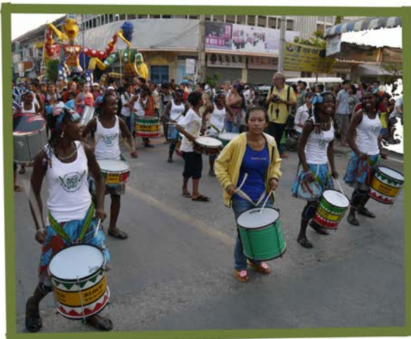
IWD (8th March) parade with Phare Ponleu Selpak (Battambang)