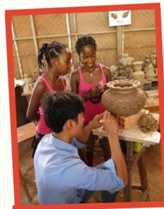
Visiting sculpture class at Royal University of Fine Arts (Phnom Penh)