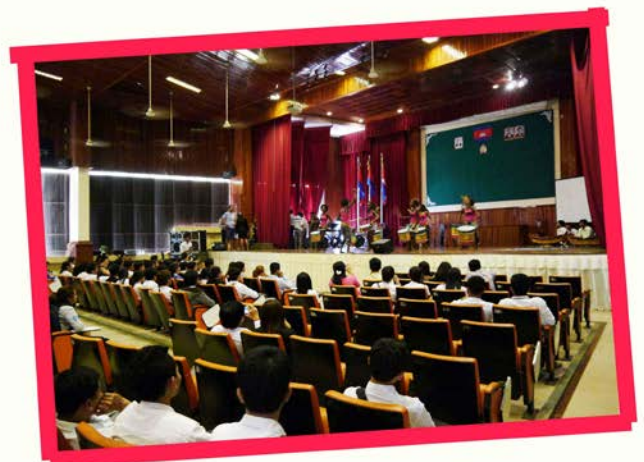
Concert at the University of Battambang