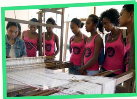
Weaving workshop at Taken village (Battambang)